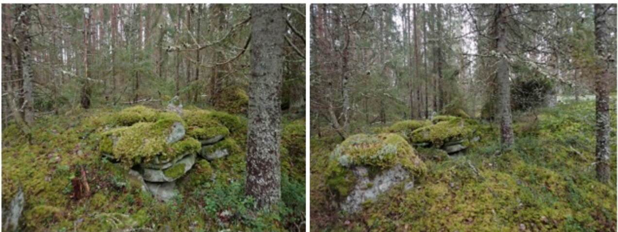
Vuotavanojan rajamerkki vuonna 2021 kuvattuna. Kuvat: Hannu Poutiainen.

Rajamerkit punaisella rasterilla Maanmittauslaitoksen pohjakartalla. Punaisilla viivoilla kiinteistörajat ja violeteilla viivoilla kunnanrajat. Muinaisjäännösten keskipisteet (ETRS-TM35FIN): Vuotavanoja P: 6752761 I: 453349, Pirunkallio P: 6752803 I: 453007.