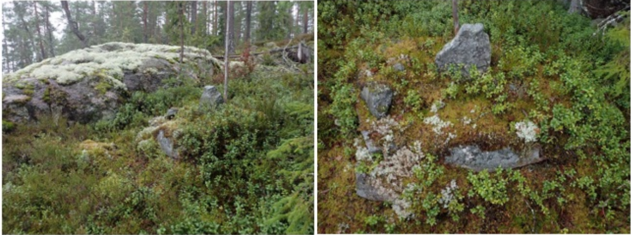
Pirunkallion rajamerkki vuonna 2021 kuvattuna.