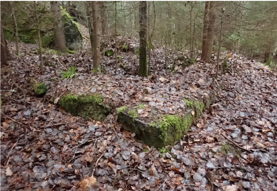
Vapuntulinmäki, rakennuksen pohja.