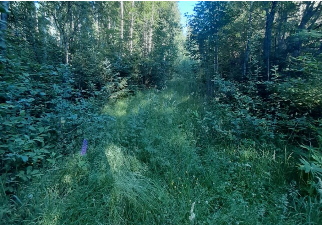
Koiskalantie, vanha tienpohja.