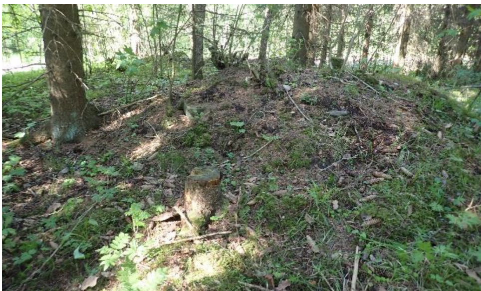
Arvela, rakennuksen tulisijan jäännös.