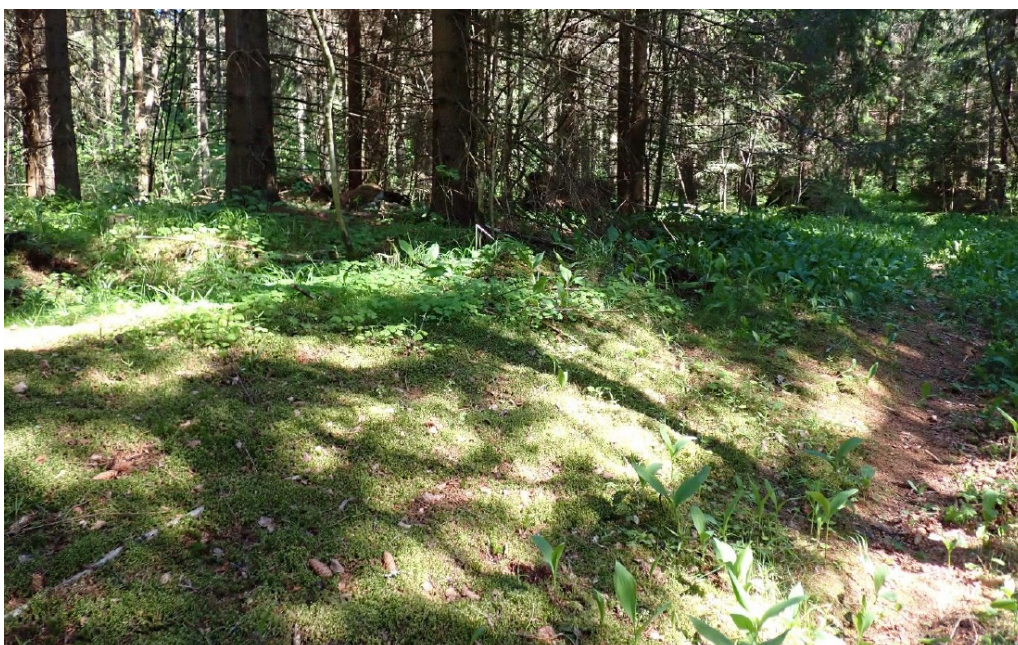
Arvela, toisen rakennuksen jäännös polun vieressä.