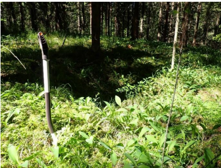
Maunula 2, nauriskuoppa.