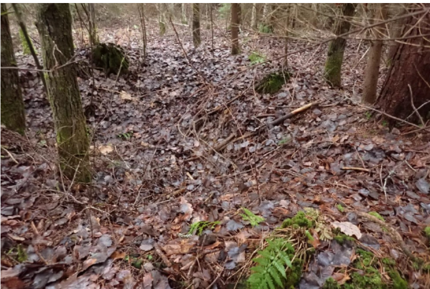
Vapuntulinmäki, kellarikuoppa.