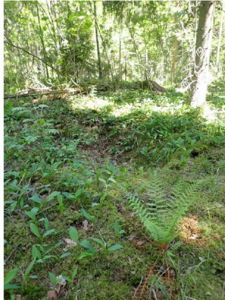
Maunula 1, kaksi nauriskuoppaa.