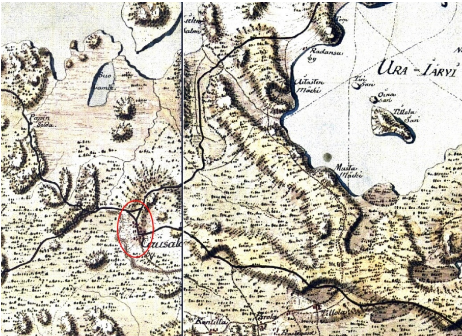
Kausalan kylä Kuninkaan kartastossa (1776 – 1805).