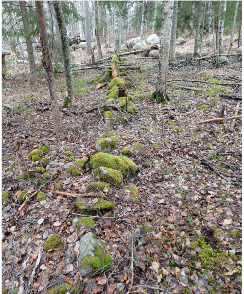
Oikealla kuva muurinjäänteistä, kuvattu etelästä pohjoiseen. Alempi kuva raivausröykkiöstä, kuvattu idästä. Kairan takana näky myös muurirakenne.