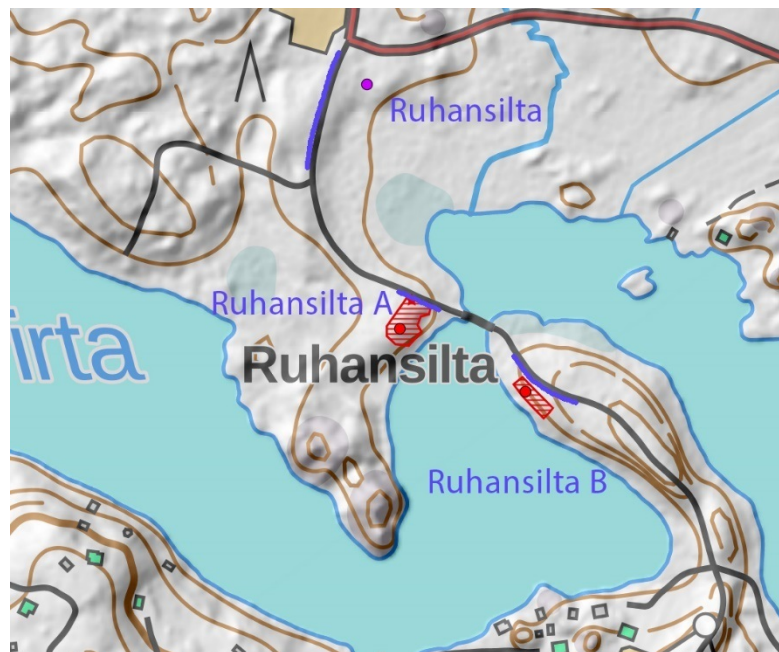
Ote muinaisjäännösrekisterin kartasta. Sinisellä merkitty arkeologin valvonnassa suoritettavien kaivuuöiden alueet.