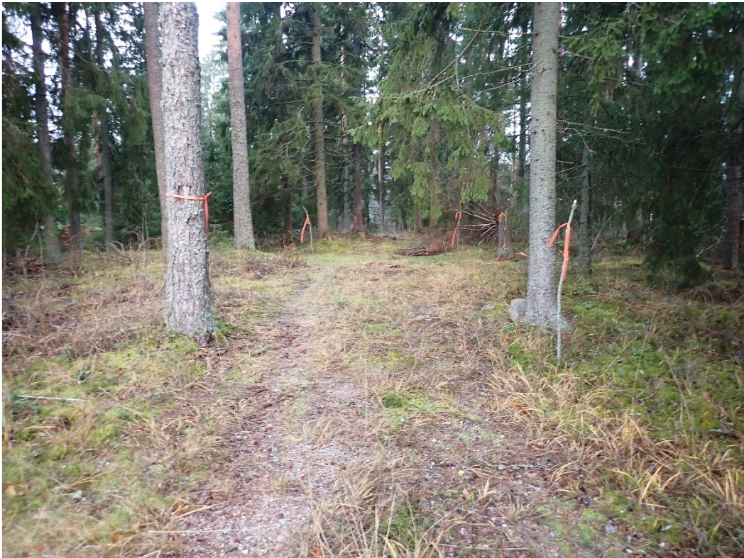
Traktoriura rajattu oransseilla nauhoilla. Kuvattu pohjoiseen muinaisjäänösalueen etelälaidalta.