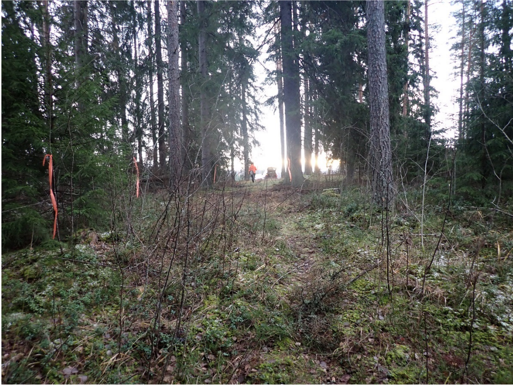
Traktoriura rajattu oransseilla nauhoilla. Kuvattu etelään muinaisjäänösalueen pohjoislaidalta.